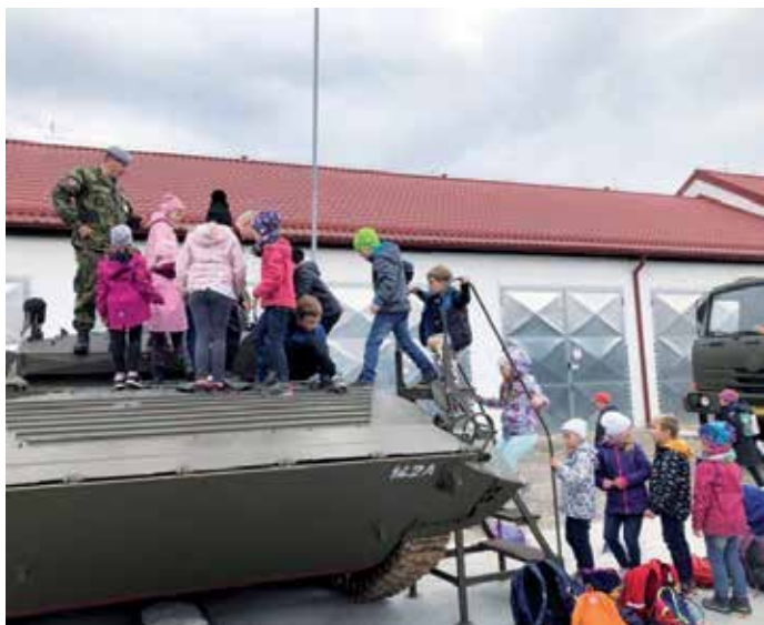
Děti při prohlídce klatovských kasáren.

V září 2022 jsme zahájili nový školní rok. Rok plný změn, ale i zažitých tradic. Rok, ve kterém stanula v čele naší školy nová paní ředitelka, která se pustila do své práce s elánem a chutí sobě vlastní. A my jí z celého srdce přejeme, aby ve své práci vytrvala, byla úspěšná a spokojená.