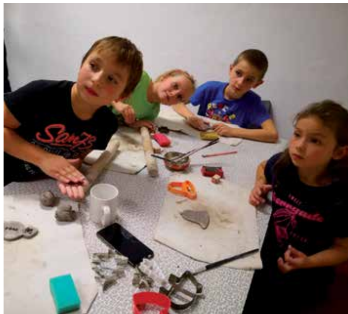
Z adventní výtvarné dílny pro děti.

lektorka vysvětlila, jak správně ovládat tablet nebo telefon a jak se bezpečně pohybovat na internetu. Seminář se uskutečnil v knihovně ve spolupráci s neziskovou organizací Moudrá sovička a byl pro všechny účastníky zdarma.