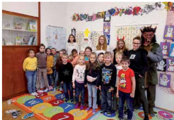
Návštěva Mikuláše, anděla a čerta.