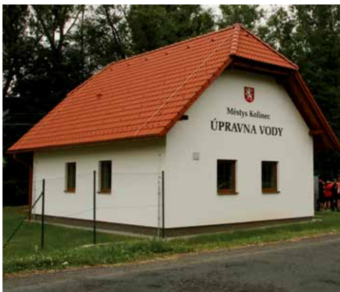
Úpravná vody městyse.