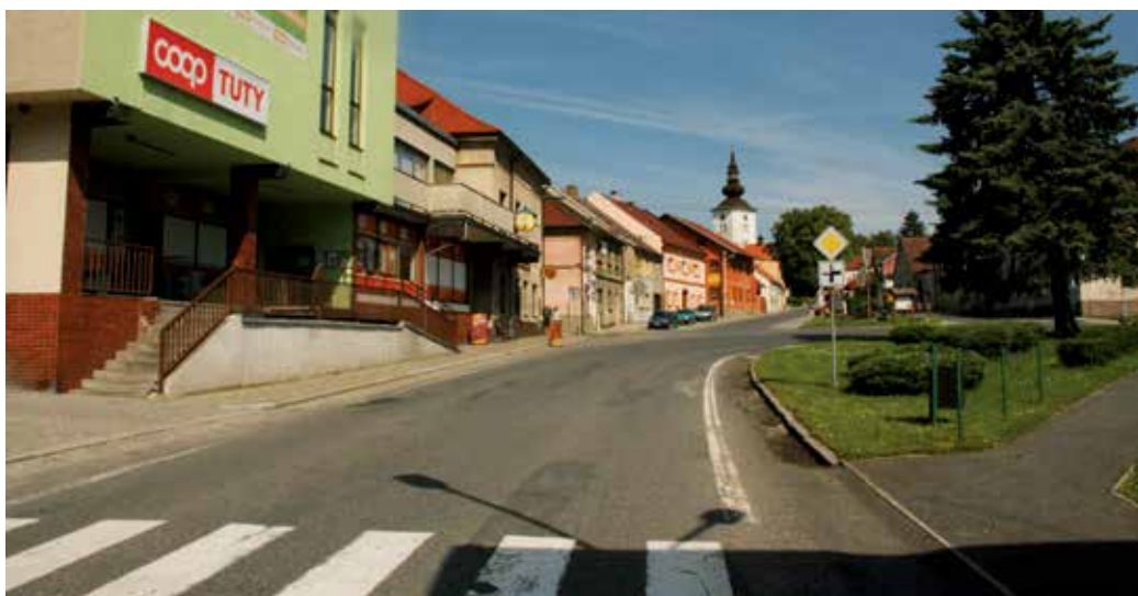
Kolinecké náměstí se silnicí II/187.