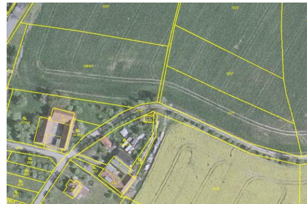
Ortofoto s obrazem katastrální mapy po obnově katastrálního operátu

Po skončení prací na obnově katastrálního operátu dochází k vyhlášení jeho platnosti. Podle § 62 odst. 2 katastrální vyhlášky (č. 26/2007 Sb.), zašle katastrální úřad sdělení o vyhlášení platnosti obnoveného katastrálního operátu obci, na jejímž území byl katastrální operát obnoven. Vyhlášení platnosti zveřejní katastrální úřad v součinnosti s obcí podle § 62 odst. 3 katastrální vyhlášky. Katastrální úřad a Český úřad zeměměřický a katastrální zveřejní vyhlášení platnosti obnoveného katastrálního operátu rovněž na svých internetových stránkách.